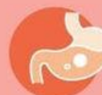
Проблемы с ЖКТ у детей